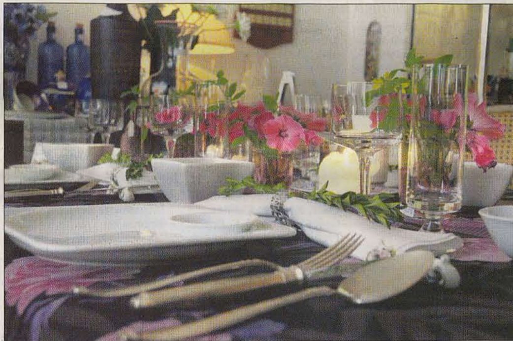
Der Blick richtet sich gleich beim Betreten des Wohntheaters auf den gedeckten Tisch mit englischem Porzellan.

Schon an der Ladentür des Second-Hand-Einrichtungshauses betritt der Besucher die „gute Stube“. Der Blick richtet sich sofort auf den mit englischem Porzellan gedeckten Tisch. Die Kerzen flackern in ihren Haltern, das Essen wird sofort serviert. Man braucht eigentlich nur Platz zu nehmen. Doch eben das ist die Illusion. Wie alles andere auch in diesem zweistöckigen Wohnhaus. Denn alles ist käuflich zu erwerben. Das gilt für den flämischen Büffet-Schrank ebenso, wie für das Silberbesteck und das hochwertige Porzellan. Das gilt für die Vasen verschiedener Epochen ebenso wie für den