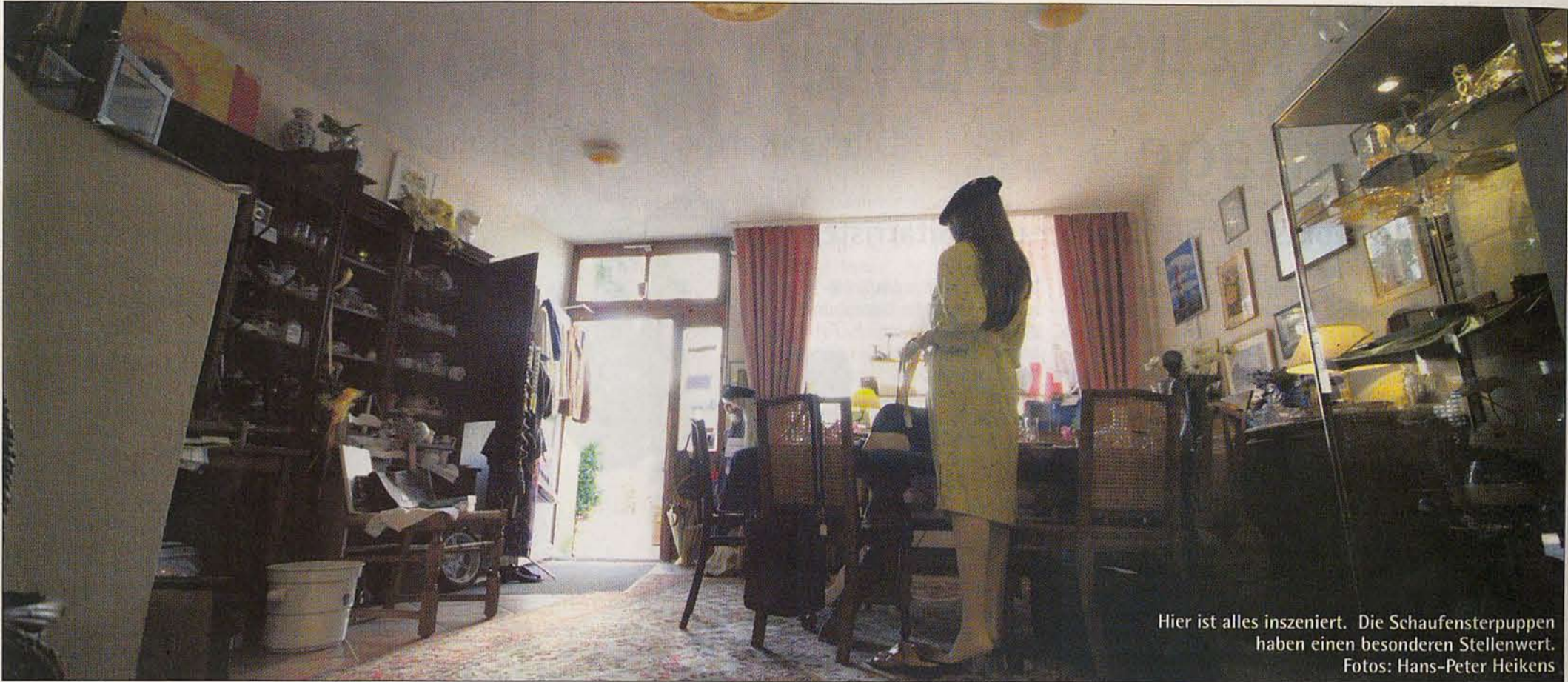
Hier ist alles inszeniert. Die Schaufensterpuppen haben einen besonderen Stellenwert.